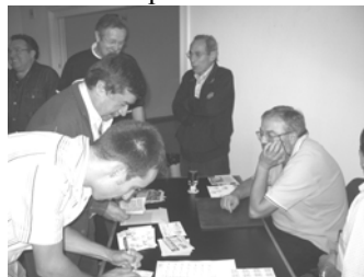
Matasellos especial (25-09-2006)