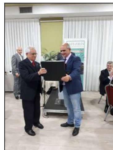
Matasellos ganador y ganador del diseño Premio Vidal Menéndez 2017