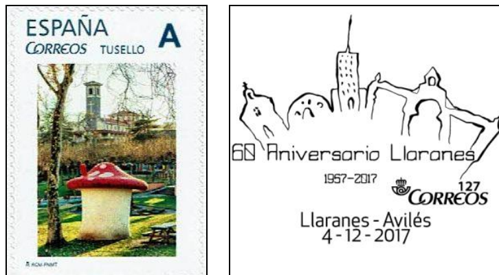
Sello personalizado y matasellos especial 60 aniversario Llaranes

* Con motivo del 60 aniversario de Llaranes, se pone en circulación un matasellos conmemorativo el día 4 de diciembre.