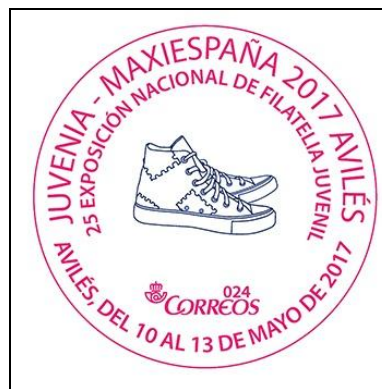
Presentación de Juvenia y MaxiEspaña 2017 y matasellos especial