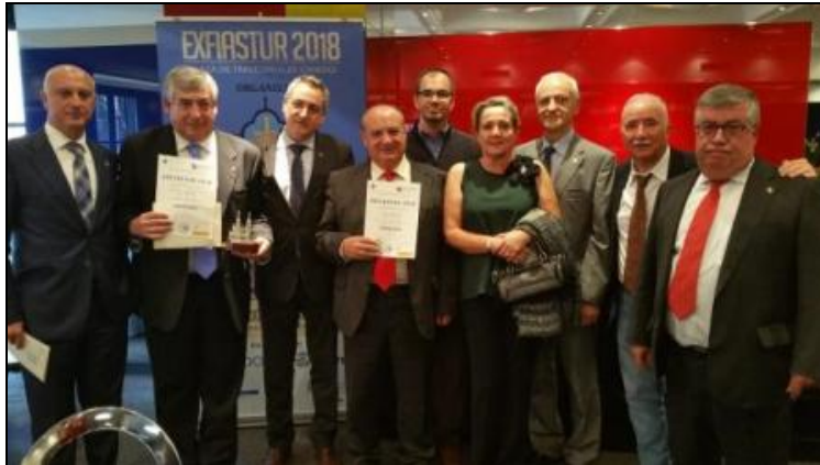
Socios participantes en la XVI Exfiastur-2018 en la comida palmarés

* Diferentes socios del grupo filatélico avilesino participaron en la XVI exposición filatélica regional "EXFIASTUR-2018" celebrada del 5 al 13 de octubre en Oviedo y organizada por la Fasfil, obteniendo el siguiente palmarés: