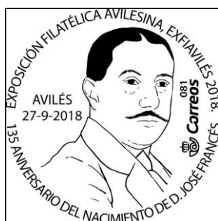
Matasellos especial con motivo de ExfiAvilés-2018

17:00 a 20:00 h. Matasellos especial y puesta en circulación del sello personalizado