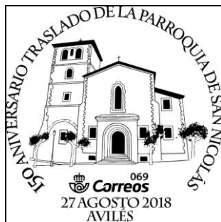
Matasellos 150 aniv. traslado de la parroquia de Avilés

* Con motivo de cumplirse en el año 2018, el 150 aniversario del traslado de la parroquia de Avilés, se puso en circulación un matasellos conmemorativo de esta efemérides el día 27 de agosto de 2018 en el claustro de la iglesia de San Nicolás de Bari en horario de 17:00 a 20:00h.