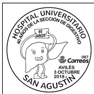
Matasellos 40 años de la sección de digestivo del Hospital Universitario san Agustín de Avilés

* Con motivo de cumplirse en el año 2018 el 40 aniversario de la sección de digestivo del hospital universitario San Agustín de Avilés, el 3 de octubre se puso en circulación un matasello especial conmemorativo en horario de 16:30 a 19:30 en el mismo hospital.