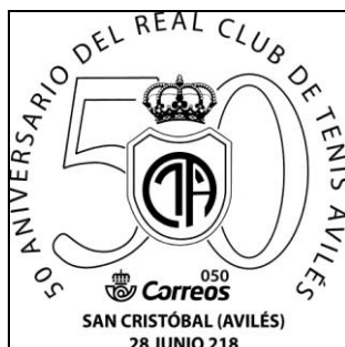
Matasellos 50 anv. real club de tenis de Avilés

* Con motivo del 50 aniversario del Real Club de Tenis Avilés, el día 28 de junio se puso en circulación un matasellos conmemorativo de esta efemérides en horario de 17:00 a 20:00 h. en las instalaciones del propio real club de tenis de Avilés.