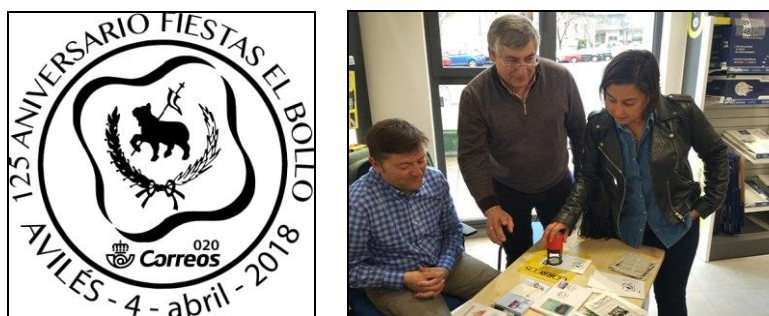
Matasellos 125 anv. fiestas del bollo de Avilés

* Con motivo del 125 aniversario de las fiestas del bollo de Avilés, el día 4 de abril se puso en circulación un matasellos conmemorativo de esta efemérides en la oficina de correos de Avilés.